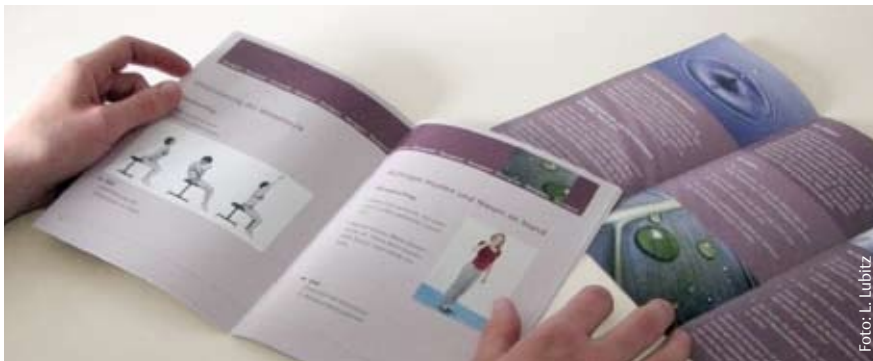
An alles gedacht: Zur Veranstaltung gehören Handouts, welche die Teilnehmerin mitnehmen kann.

zu können. Die Physiotherapeutin hat in diesem Konzept eine zusätzliche Lotsenfunktion. Frauen sollen von ihr ermutigt werden, sich einem Arzt anzuvertrauen, bei Bedarf spezielle Übungen und Verhaltensweisen bei einer Physiotherapeutin zu erlernen oder in einem örtlichen Sportverein entsprechende Angebote wahrzunehmen. Der kontinenzfördernde Effekt von Geburtsvorbereitungskursen, Rückbildungsgymnastik und der Beckenbodenschule soll unterstrichen werden.